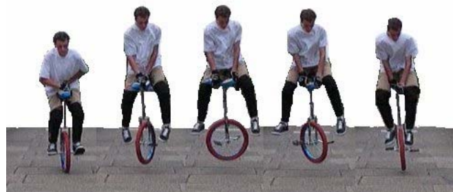
180 uni spin

180/360 uni spin (en roulant ou en statique) : là c'est le même principe que pour la montée mais vous prenez votre impulsion (pour le saut) sur les pédales du mono, pour une meilleure rotation, vous pouvez tenir la selle avec vos deux mains