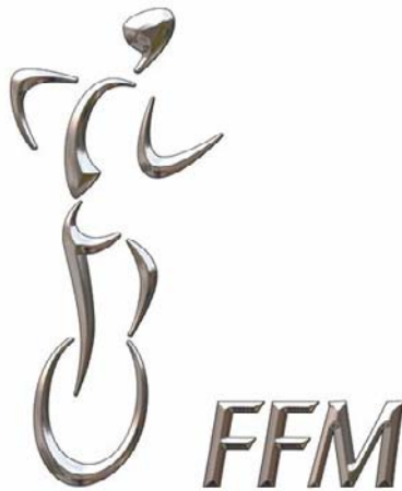
Fédération France Monocycliste

- la mise en place de représentants locaux qui sont les représentants de la FFM dans leur département et qui se chargent de favoriser le développement du monocycle à cette échelle.