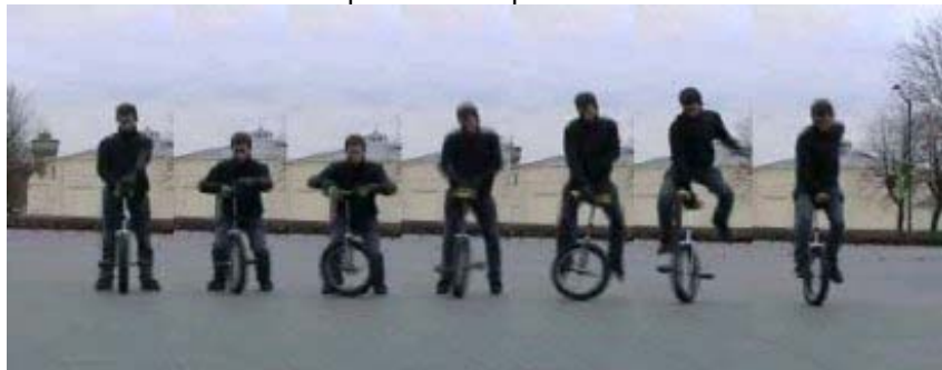
montée 360 uni spin

Montée 360 uni spin : on se place derrière le mono, main gauche sur l'avant de la selle et la main droite sur l'arrière droit de la selle, les pédales bien horizontales. Sauter et commencer la rotation du mono dans le sens inverse des aiguilles d'une montre. Quand vous serez à la moitié de la rotation, ramenez votre main droite sur la partie avant gauche de la selle (attention elle se retrouve à l'envers) et vous pouvez recaler la main gauche, puis atterrir des deux pieds sur les pédales.